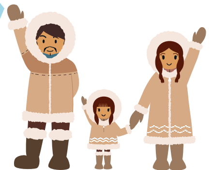
◀北極ボードゲーム『The Arctic』