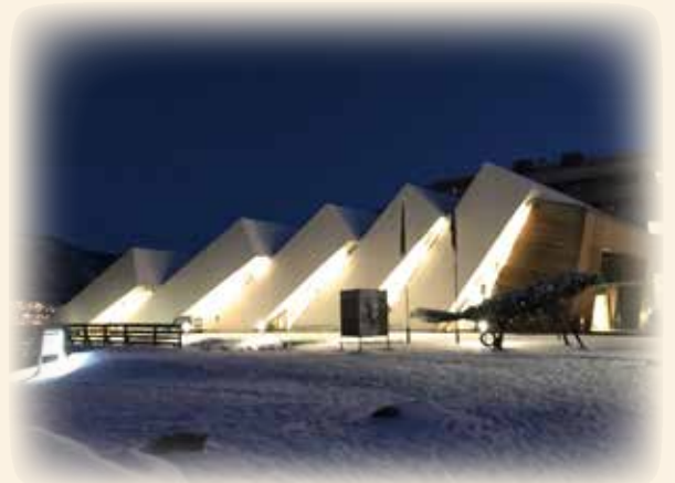
▲北極圏を紹介する水族館 "Polaria" (ノルウェー・トロムソ)